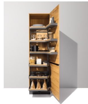
Colonna con estrazione tandem

La nuova struttura tandem di TEAM 7 migliora l'ordine e l'accessibilità e offre maggiore spazio contenitivo nelle colonne della cucina, dove è importante sfruttare con intelligenza ogni singolo millimetro. Le mensole sulle ante e gli elementi a estrazione nella parte superiore dell'armadio assicurano posto a sufficienza per utensili da cucina o scorte alimentari. Anche la parte inferiore è l'ideale per conservare invece le cose più ingombranti.