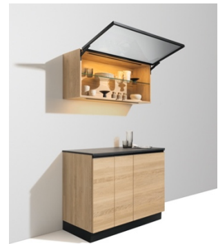
pensile con frontale in vetro e cornice in alluminio: estetica perfetta grazie al nuovo meccanismo high-tech

Le cucine TEAM 7 sono realizzate su misura e si adattano non soltanto alle esigenze di spazio, ma anche al flusso di lavoro creativo. Le nuove basi a estrazione sono la sintesi perfetta di estetica, organizzazione e altissima capacità contenitiva: il loro aspetto è snello, ma con l'aggiunta di alcuni extra ben studiati sono in grado di facilitare il lavoro in cucina, nascondendo con discrezione tutti quegli utensili che si preferisce non tenere a vista.