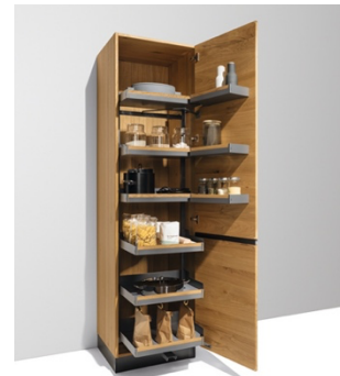
Spazio ben ordinato e comodamente accessibile