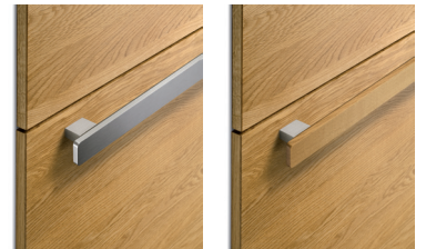
Der neue Stangengriff mit Edelstahl-Finish oder in Holz

Als neueste Küchenreation von TEAM 7 setzt die cera line neben Holz ein weiteres hochwertiges Naturmaterial perfekt in Szene: Keramik. Der großzügige Einsatz des Werkstoffs ist das zentrale Designmerkmal und bildet einen spannenden Kontrast zu den natürlichen Holzoberflächen. Zudem überzeugt Keramik mit zahlreichen Vorteilen im täglichen Gebrauch. Hygienisch und pflegeleicht ist sie bestens geeignet für den Kontakt mit Lebensmitteln. Selbst Messerklingen, Flüssigkeiten oder gar Säuren können dem widerstandsfähigen Material nichts anhaben. Durch die geschmackvolle Kombination aus Holz und Keramik wird ein besonders warmer, wohnlicher Charakter erzeugt.