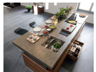
Arbeitsbereich und Bartheke in einem