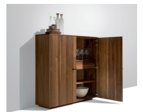
filigno Anrichte und Highboard verbinden kochen, essen und wohnen

Diese und weitere Presstexte und -fotos stehen auf www.team7.at zum Download bereit.