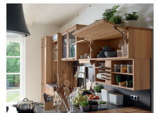
Funktional und übersichtlich

Diese und weitere Presstexte und -fotos stehen auf www.team7.at zum Download bereit.