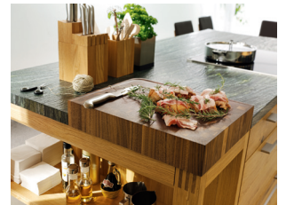
Integrierter Butcher-Block mit Safrille

Die loft Küche verbindet die Natürlichkeit des Holzes – samt seinen charakteristischen positiven Eigenschaften – mit der eleganten Ausführung handwerklicher Details und dem hohen Anspruch an Funktionalität.