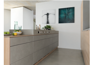
Kücheninsel mit Keramik-Arbeitsblock

Bei der Planung ihrer filigno Traumküche können sich Kunden zwischen diversen Holzarten, Farbglas- oder Keramikfronten sowie verschiedenen Griffvarianten entscheiden. Das Innenleben der Küche wird ebenfalls ganz individuell gestaltet. So entstehen hochwertige Küchen-Unikate.