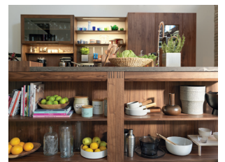
Authentische Materialien und hohe Handwerkskunst

Diese und weitere Presstexte und -fotos stehen auf www.team7.at zum Download bereit.