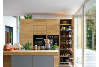
linee: Design und Stauraum ganz nach Wunsch und Bedarf

Mit der l1 sieht auch die kostenbewusste Küchenplanung äußerst individuell aus. Die einzelnen Elemente der l1 können nach Belieben mit den Schränken des umfangreichen linee Programms kombiniert werden. Daraus ergeben sich beinahe endlose Gestaltungsmöglichkeiten. Wie bei der linee können auch bei der l1 Küche offene Naturholzkorpuse als Nischen oder Vitrinen integriert werden. Wandborde in U-Form schaffen spielerisch Raum für Küchenutensilien oder den Kräutergarten.