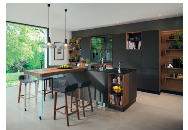
black line Küche

Mit der black line hat TEAM 7-Chefdesigner Sebastian Desch eine besonders elegante Gestaltungsvariante der linee Küche vorgestellt. Schwarzes, mattes Farbglas wird kombiniert mit edlem Rauchglas sowie Griffprofilen und Sockelblenden in mattem Schwarz. Offene und geschlossene Gestaltungselemente aus reinem Naturholz sorgen für Auflockerung im Küchenbild und eine wohnliche Anmutung. Im Herzen ist auch die black line eine echte Naturholzküche: Hinter der kühlen Eleganz der schwarzen Flächen steckt ein Korpus aus massivem Holz, das Wärme ausstrahlt und der Küche Stabilität verleiht. Bei der konsequent puristisch gestalteten Variante einer Naturholzküche verbinden sich Holz, Glas und Metall zu einer modernen Wohnlichkeit.