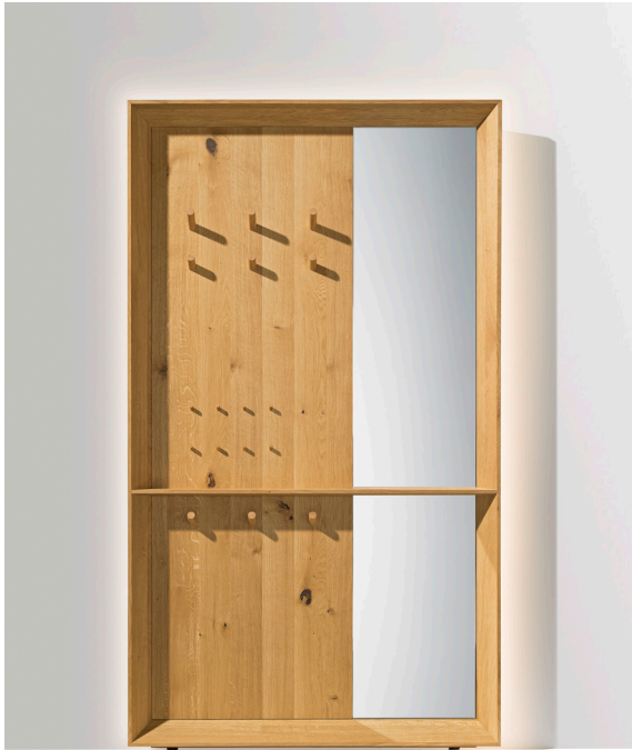
haiku Spiegel mit Naturholzpaneel