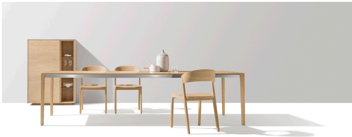
tak Tisch, mylon Stuhl, filigno Highboard

Diese und weitere Presstexte und -fotos stehen auf www.team7.at zum Download bereit.