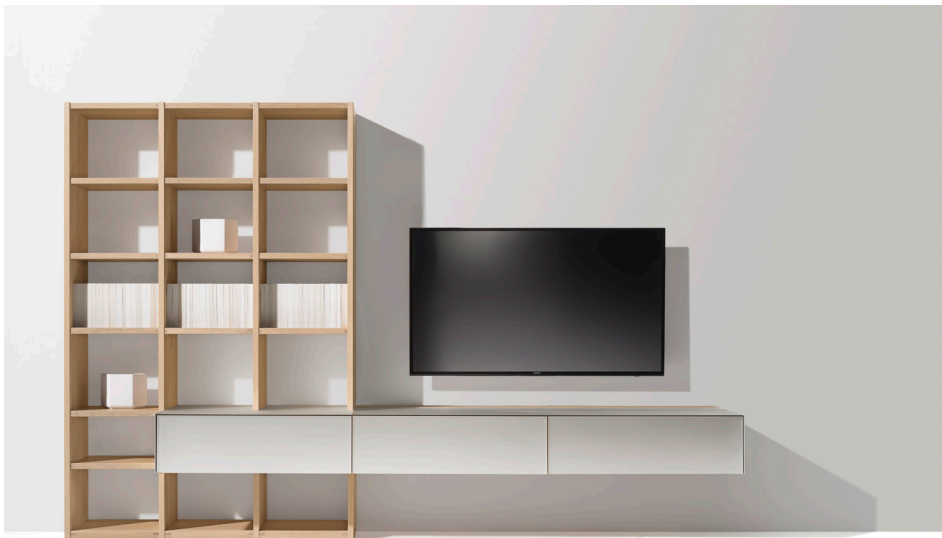
cubus pure Wohnwand, Glasfarbe pearl

Diese und weitere Presstexte und -fotos stehen auf www.team7.at zum Download bereit.