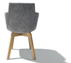
Macht auch von hinten eine gute Figur