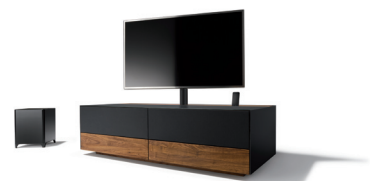
cubus pure Home Entertainment mit TV-Säule in Schwarz matt

Bereits im vergangenen Jahr hat TEAM 7 die Metallfarbe „ Schwarz matt “ eingeführt. Metall mit matter, schwarzer Oberfläche passt hervorragend zum Industrial-Stil, aber auch zu vielen anderen modernen Wohnraumgestaltungen. Zunächst wurde das Drehgestell des Stuhls lui in der Farbe „ Schwarz matt “ vorgestellt. Aufgrund der großen Beliebtheit erweitert TEAM 7 nun sein Angebot an Möbeln mit Metallelementen in der Trendfarbe. Das neue Drahtgestell für die Stühle lui und grand lui wird ebenso in „ Schwarz matt “ angeboten wie das Gestell des magnum oder f1 Stuhls und die schlanken Beine des Tisches tak . In der Küche werden Griffe in „ Schwarz matt “ gestaltet. Auch im Wohnzimmer wird die Trendfarbe zelebriert: mit der Bodenplatte des Couchtisches lift und der TV-Säule.