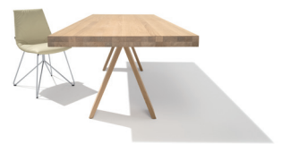
tema in Eiche Weißöl mit A-Fuß

Diese und weitere Presstexte und -fotos stehen auf www.team7.at zum Download bereit.