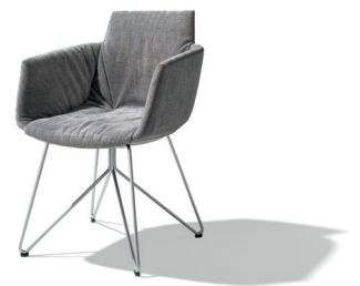
Der neue Dining Chair: grand lui mit filigranem Drahtgestell

Die Basis der Sitzmöbel aus der lui Familie bildet eine solide, ergonomisch geformte Formholzschale. Gemeinsam mit einem maßgeschneiderten Formschaummantel, gekleidet in edles Leder oder Stoff, schmiegt sich der Stuhl so perfekt an den Körper. Der charakteristische Faltenwurf bei den Stühlen grand lui und lui erinnert an den fließenden Stoff eines Haute-Couture-Kleides. Man kann aber auch an Lachfältchen oder an ein Zwinkern denken, wenn man den Stühlen der lui Familie ins Antlitz blickt. Dieser Faltenwurf wirkt zufällig, ist aber das Ergebnis von viel technischem Know-how gepaart mit detailverliebter Handarbeit. Der Clou dabei: handwerkliche Einzüge, bekannt aus dem traditionellen Polsterhandwerk. Beim grand lui wird der Faltenwurf, der bereits in der Sitzschale beginnt, in den Armlehnen weitergeführt. Der Polsterstuhl grand lui ist ein