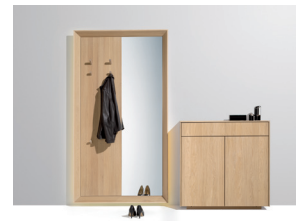
haiku Kombipaneel mit Beleuchtung und filigno Kommode

Eine flexible Ergänzung oder Alternative zu Wandpaneel, verdeckter Garderobe und geschlossenem Schrank stellt der Kleiderständer hood dar. Die vierarmige Konstruktion besteht aus einem durchgehenden X-Element, an das in einem sanft geschwungenen Knotenpunkt zwei Seitenteile andocken. Und sollte noch mehr Platz benötigt werden, so kann man sich für seinen großen Bruder hood+ entscheiden, bei dem zwei Grundelemente mit einem Holzholm verbunden werden.