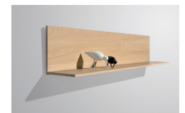
Wandbord in L-Form