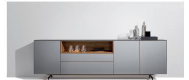
cubus pure Anrichte

Die Grundidee für den sol Solitär bilden zwei ineinanderlaufende Schalen: Die ausziehbare Schreibtischplatte ist mit Leder oder Naturleder bezogen, die zweite Schale inszeniert außen wie innen das schöne und handwerklich anspruchsvoll verarbeitete Naturholz. Ausgezogen bietet sol großzügig Raum zum Sitzen und komfortablen Zugriff auf das Innenleben: Eine Steckdose mit USB-Anschluss, drahtlose Qi-Ladetechnologie, Boxen für Utensilien, sorgfältig ins Naturholz gefräste Stiftschalen, ein Geheimfach und optionale LED-Beleuchtung machen sol zu einem smarten und vollwertigen Arbeitsplatz. Ob