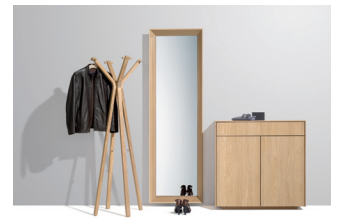
hood Kleiderständer, haiku Spiegel und filigno Kommode

Diese und weitere Presstexte und -fotos stehen auf www.team7.at zum Download bereit.