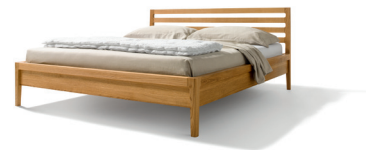
Beimöbel passend zum mylon Bett