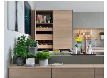
Ganz natürlich und sinnlich

Die Küche von heute versteckt sich nicht mehr hinter verschlossenen Türen, sondern ist offen, gastfreundlich und vor allem flexibel. Die Grundrisse der modernen Wohnungen geben Raum dafür. Für dieses Trendthema hat TEAM 7 in Zusammenarbeit mit dem Designbüro Tesseraux + Partner das kombinierte Küchen- und Beimöbelprogramm filigno entwickelt. Mehr Möbel als Küche, macht es mit den Naturmaterialien Holz und Keramik Appetit auf eine neue Gemütlichkeit. Ob als Anrichte, Arbeitsblock oder funktionelle Kochinsel – das System garantiert mit klarer Designhandschrift formsicheres Geleit aus der Küche in den Living-Bereich. Und ist raffiniert durchdacht: Während ein aufgesattelter Arbeitsblock in Keramik Platz für das Zubereiten der Speisen bietet, übernimmt der vordere Teil der Insel die Funktion einer Anrichte. Leicht, filigran und mit holzbetonter Eleganz. Ebenfalls perfekte Begleiter für die Verschmelzung von Küche, Wohnen und Speisen sind die filigno Beimöbel. Sie lassen viel Freiraum für offene Lösungen. Pur und hochwertig: denn die erlesenen Side- und Highboards werten alle Räume mit präzisen Verarbeitungsdetails und smarter Funktionalität stilvoll auf.