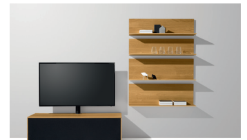
filigno Home Entertainment in Eiche