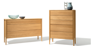
mylon Kommoden in Eiche

Klein, aber oho: Bettlektüre, Lesebrille, Wasserglas und Duftkerze finden auf und in dem neuen mylon Nachtkästchen Platz. Das formschöne Schränkchen aus Naturholz wird in verschiedenen Varianten – offen oder mit einer Schublade, in normaler Höhe