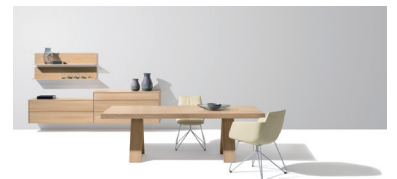
tema Tisch in Eiche Weißöl, filigno Anrichte und lui/grand lui Stuhl