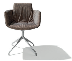
grand lui mit Maple Stoff und Drehgestell