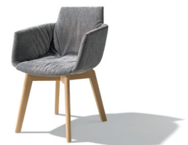
grand lui mit klassischem Holzgestell

GeSK agentur für public relations Ziegelstraße 29 | D-10117 Berlin Telefon: +49/30/217 50 460 | Fax: +49/30/217 50 461 E-Mail: pr@gesk.berlin | www.gesk.berlin