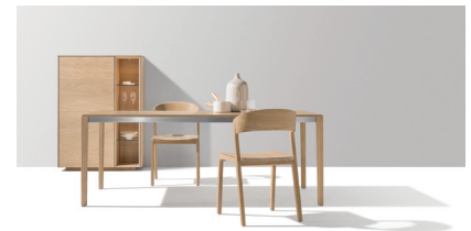
tak Tisch, mylon Stuhl und filigno Highboard

Diese und weitere Presstexte und -fotos stehen auf www.team7.at zum Download bereit.