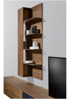
Wandpaneel mit Sichtschutz

Beim Programm filigno steht ganz klar das reine Naturholz im Vordergrund. Um bei Planungen mit filigno komplett in diesem Werkstoff bleiben zu können, hat TEAM 7 einen neuen Holzgriff entwickelt, der passend zum Möbelstück in der gewählten Holzart gefertigt wird. Der zarte, aber äußerst funktionale Griff passt mit seiner Materialstärke von 12 mm