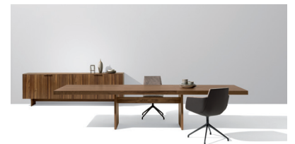
tema Tisch in Nussbaum, filigno Anrichte und lui/grand lui Stuhl

Zwei verschiedene Fußvarianten stehen beim Esstisch tema zur Auswahl, die gleichermaßen harmonisch mit der Tischplatte verschmelzen. Massive Holzwanen sorgen für einen sicheren Stand und unterstreichen gleichzeitig die Geradlinigkeit und den zeitlosen Charakter des Entwurfs. Die Querzarge dient als handwerkliches Designelement und garantiert höchste Stabilität. Beim tema Tisch mit A-Fuß scheint die Tischplatte auf der Spitze des „A“ zu balancieren. Ein Kunststück mit Wow-Effekt – besonders dann, wenn man den Tisch von der Stirnseite betrachtet. Die A-Füße verleihen tema ein modernes,