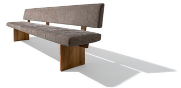
yps Bank mit Holzwange

Der in diesem Jahr neu vorgestellte Esstisch tema kann selbstverständlich mit verschiedenen Stühlen von TEAM 7 wie dem lui oder dem grand lui – ebenfalls frisch aus der Design-Manufaktur – kombiniert werden. Wer eine Sitzbank bevorzugt, findet in der yps Polsterbank mit ihrem dynamisch wirkenden, ausgestellten Y-Fuß eine geeignete Begleiterin für den tema Tisch mit A-Fuß. Um auch für den Esstisch tema mit Wangenfuß eine passende Bank anbieten zu können, hat TEAM 7 die beliebte yps Bank weiterentwickelt und mit einem neuen Holzwangengestell ausgestattet. Wie beim Tisch findet sich auch