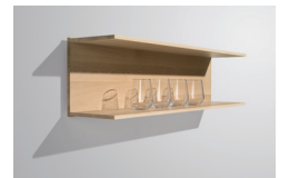
Wandbord in C-Form