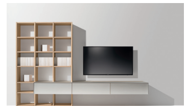
cubus pure Wohnwand mit Glasfarbe pearl