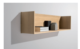
Wandbord in U-Form

Diese und weitere Presstexte und -fotos stehen auf www.team7.at zum Download bereit.