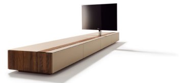
cubus Home Entertainment