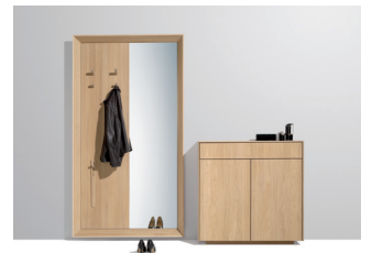
filigno Kommode mit haiku Kombinpaneel

Diese und weitere Presstexte und -fotos stehen auf www.team7.at zum Download bereit.