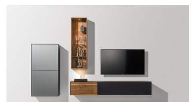
cubus pure Wohnwand

Diese und weitere Presstexte und -fotos stehen auf www.team7.at zum Download bereit.