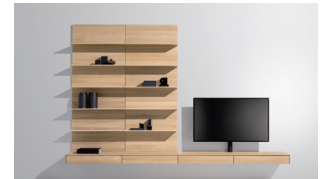
filigno Wohnwand mit besonders schmaler Konsole

TEAM 7 stellt außerdem eine neue Wandpaneel-Variante für filigno vor. An einer Seite werden die offenen Borde durch eine Naturholzplatte abgedeckt. So entsteht ein teils