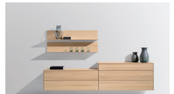
filigno Anrichte in Eiche Weißöl

Diese und weitere Presstexte und -fotos stehen auf www.team7.at zum Download bereit.