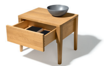
Platz für alles, was man braucht

Diese und weitere Presstexte und -fotos stehen auf www.team7.at zum Download bereit.