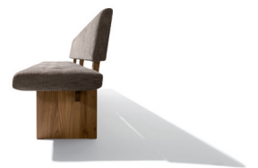
Holzwanne passend zu tema Tisch

Diese und weitere Presstexte und -fotos stehen auf www.team7.at zum Download bereit.