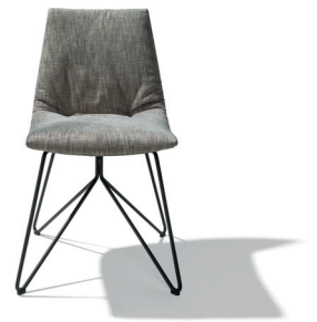
lui Stuhl mit Maple Stoff und Gestell in Schwarz matt

TEAM 7 erweitert in diesem Jahr sein Bezugsstoff-Repertoire: Mit den „ Maple “ Stoffen von Kvadrat haben TEAM 7-Kunden nun noch mehr hochwertige Textilien für die Gestaltung eines persönlichen Lieblingsmöbelstücks zur Auswahl. Die von der Schönheit der Wälder und dem Japanischen Ahorn inspirierte Stoffkollektion passt ausgezeichnet zum Naturholzspezialisten TEAM 7. Die „ Maple “ Stoffe werden mit einem hohen Anteil an Viskose gewebt, einer glänzenden Zellulosefaser, die aus Holz gewonnen wird. Durch die Viskose erhalten die Stoffe einen besonderen Glanz, der sich je nach Lichteinfall und Perspektive des Betrachters verändert. Die „ Maple “ Kollektion ist mit einem Chenille-Garn gewebt und verzaubert mit weichem Flor, samtiger Anmutung und einer außergewöhnlichen Haptik. In 13 Farben – einer harmonischen Palette aus natürlichen Nuancen – sind die Stoffe erhältlich. Sie können als Bezugsstoffe für viele Stühle und Bänke von TEAM 7 gewählt werden. Auch im Schlafzimmer kommt die neue Kollektion zum Einsatz: Das Bett float , das Bett mylon und die mylon Bank können mit „ Maple “ Stoff bezogen werden.