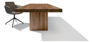
tema Tisch mit Holzwanne

Schnell, komfortabel, intuitiv – die von TEAM 7 entwickelte, patentierte nonstop Auszugstechnik wurde erstmals mit dem Tisch flaye vorgestellt. Nun kommt sie mit verbesserter Leichtgängigkeit und noch mehr Beinfreiheit im neuen Esstisch tema zum Einsatz und sorgt mit ihrer Benutzerfreundlichkeit erneut für Staunen. Wer den tema verlängern möchte, zieht ihn einfach in die Länge. Ein Handgriff, ein Ruck an der Stirnseite des Tisches – schon öffnet sich leise die synchron ausziehbare Tischplatte in der Mitte und lässt die gedämpften Einlegeplatten automatisch ausschwenken. Ohne Mühe, ohne Zeitaufwand, ohne Klappern. In Sekundenschnelle, in einer durchgehenden Bewegung, wächst der tema Tisch um 100 cm und bietet im Handumdrehen vier zusätzliche Sitzplätze. Das Verkleinern des Esstisches mit nonstop Auszug funktioniert ebenso einfach und intuitiv. Dank der patentierten Ausschwenktechnik wird die Bewegung der integrierten Einlegeplatten in beiden Richtungen gedämpft. Die gedämpften Einlegeplatten gleiten beim Ausschwenken sanft hinaus und senken sich leise. Ein wahres Meisterwerk hoher Ingenieurs- und Handwerkskunst.