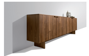
filigno Anrichte mit Holzgriff und Holzwanne

Diese und weitere Presstexte und -fotos stehen auf www.team7.at zum Download bereit.