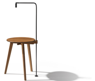
hi! Beistelltisch mit LED-Leuchte

Der runde hi! Beistelltisch macht mit nur 2,3 kg Gesamtgewicht flexibel überall da eine gute Figur, wo man ihn braucht: ob im Wohnzimmer, im Eingangsbereich oder im Schlafraum. Drei Fußelemente aus massivem Naturholz bilden mittels Kreuzüberblattung und Schlitz-Zapfen-Verbindungen die Basis für die enorme Stabilität und Standfestigkeit. Eines der Fußelemente ist über die Tischplatte hinaus verlängert. Dieses Detail macht hi! zum Multitalent: Eine Lederschleife fürs einfache Handling, eine Aufhängung für den hochwertig und in derselben Holzart verarbeiteten TEAM 7-Schuhlöffel oder als wahres hi! -Light eine dreh-, schwenk- und neigbare LED-Leuchte – dieser Tisch ist vielseitig. Alternativ zu Naturholz mit Lederkeder – Designelement und Kantenschutz zugleich – kann die Tischplatte auch in Klarglas gewählt werden. Dieses verstärkt die feine Anmutung, und die konstruktiven Naturholzdetaile bleiben uneingeschränkt sichtbar.