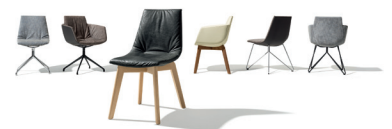
lui/grand lui Familie

Diese und weitere Presstexte und -fotos stehen auf www.team7.at zum Download bereit.