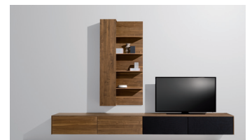
filigno Wohnwand in Nussbaum

Durch die offenen Grundrisse moderner Wohnungen verschmelzen die einst klar getrennten Bereiche Kochen, Speisen und Wohnen zunehmend miteinander. Mit dem Programm filigno von TEAM 7 werden elegante, fließende Übergänge zwischen Küche, Ess- und Wohnbereich möglich. Für die filigrane Anmutung der filigno Naturholzmöbel sorgen die lediglich 12 mm dünnen Dreischichtplatten, die den Korpus ummanteln, raffiniert kombiniert mit einer feinen Schattenfuge. Dank der fortschrittlichen Dreischichttechnologie von TEAM 7 sind die Naturholzplatten – trotz ihrer geringen Materialstärke – enorm stabil. Hirnholzeinleimer unterstreichen die Handwerklichkeit und die Naturholzkompetenz von TEAM 7.