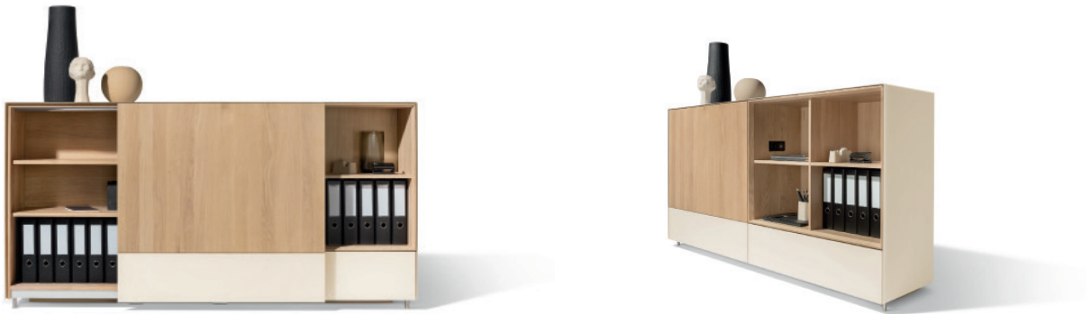
cubus pure Anrichte mit flächenbündiger Schiebetür und Farbglass-Elementen