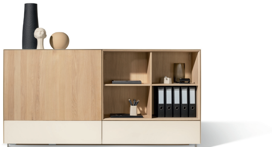
cubus pure Anrichte: macht überall eine gute Figur