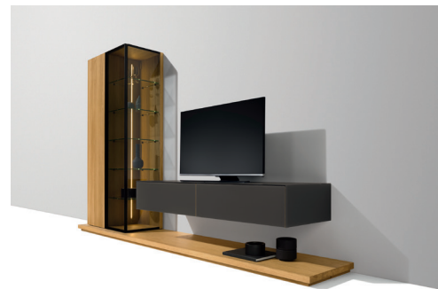
cubus pure Wohnwand mit neuer Glasfarbe Graphitgrau