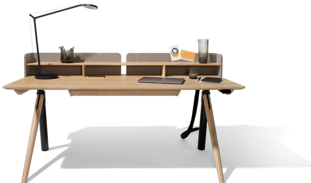
pisa Schreibtisch mit Aufsatz und Lade