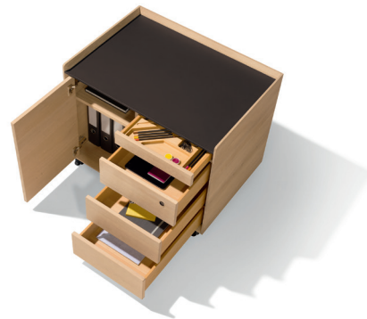
Bürobedarf praktisch verstaut