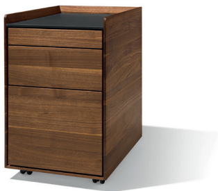
Flexibel einsetzbar durch Rollen