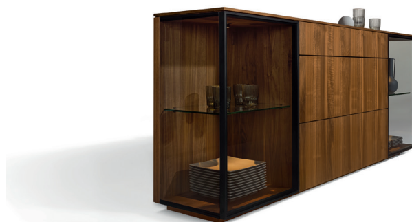
filigno Anrichte 21 mit Alurahmenfront

Mit einem eindrucksvollen Auftritt begeistert ebenfalls die filigno Anrichte 21 mit Alurahmenfront. Die Glaselemente über Eck in Klarglas oder Rauchglas werden mit beweglichen, schwarzen Spots beleuchtet und setzen so Accessoires edel in Szene. Im Mix mit geschlossenen Ladenfronten entsteht auf diese Weise ein sehr individuelles Möbel für alle Gelegenheiten. Optional findet auch ein Besteckeinsatz Platz. Die neue filigno Anrichte kann in zwei Breiten, zwei Tiefen sowie in allen TEAM 7 Hölzern geplant werden.