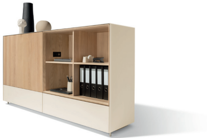
cubus pure Anrichte mit neuer Glasfarbe Naturweiß

Mit einer neuen Lederfarbe und drei neuen Glasfarben erweitert TEAM 7 sein facettenreiches Repertoire um zusätzliche Nuancen. Durch das Zusammenspiel mit den verschiedenen Holzarten entstehen neutrale, schlichte und dennoch angenehm wohnliche Farbkombinationen, die den persönlichen Stil-Vorlieben Freiraum gewähren. Somit lässt sich jede bunte Lieblingsvase gut in das Farbschema einpassen. Die neuen Glasfarben Hellgrau und Graphitgrau strahlen kühle Eleganz aus und verbinden sich ebenso wie das sanfte Naturweiß stilvoll mit der warmen Anmutung des Holzes. Hellgrau ergänzt zudem die Auswahl der Lederfarben L1 und betont den edlen Charakter der Möbelstücke.