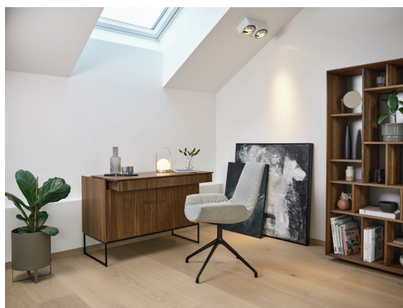
filigno Sekretär und lui plus Stuhl mit Drehgestell