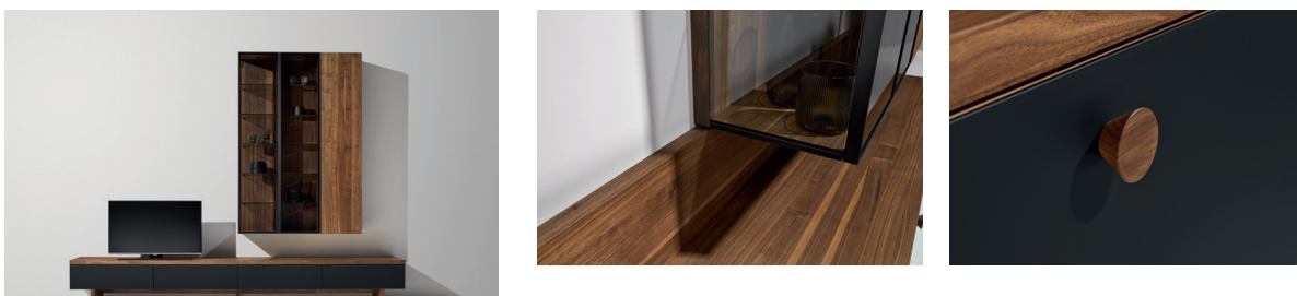
Die starke Deckplatte, die Alurahmentüren und der Griff dot kreieren individuelle cubus Wohnwände.

Mit den neuen schwarz matten Alurahmentüren in Klarglas oder Rauchglas eröffnet TEAM 7 weitere, elegante Möglichkeiten in der individuellen Gestaltung von Wohnwänden, Highboards oder Anrichten. Die Glaselemente sorgen für spannende Ein- und Durchblicke und harmonisieren perfekt mit allen TEAM 7 Holzarten. Im Holzkorpus versenkt und vom Alurahmen verdeckt, rücken die Türbänder diskret in den Hintergrund. So können die Alurahmentüren – unterstützt von dimmbaren LED-Lichtbändern oder brillanten Spots – ihre volle Strahlkraft entfalten.