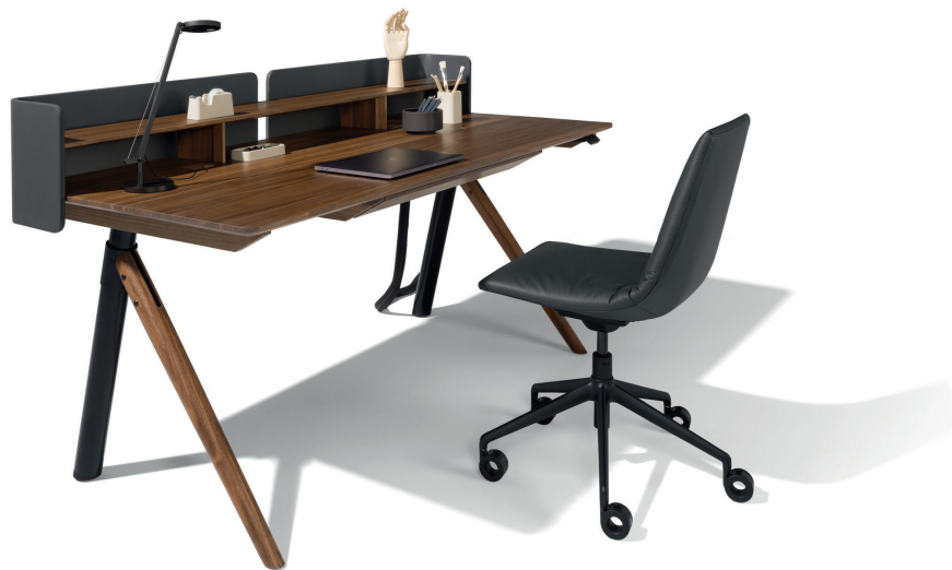
pisa Schreibtisch und lui Bürodrehstuhl

Materialien: Formholzschale, Schaummantel, Drehgestell aus Druckguss, große Stoff- und Leder-Auswahl