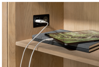
Details: cubus pure Anrichte mit ausziehbarer Lade und Stromanschluss im offenen Fach