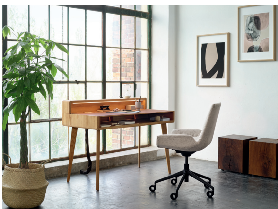
sol Solitär und lui plus Bürodrehstuhl

Mit wohnoofficeT7 hält TEAM 7 alles bereit, um funktionale und zugleich designstarke Home-Office-Bereiche einzurichten. Maßgefertigt richten sich Möbel und Systemlösungen von der Größe über die Materialien bis hin zum Innenleben flexibel nach den Wünschen des Einzelnen. Die detailliert geplanten Konzepte werden dabei konsequent nachhaltig in liebevoller Handarbeit und aus den besten Zutaten der Natur hergestellt. Die ausschließlich mit Naturöl veredelten Hölzer unterstützen ein angenehmes Raumklima und schaffen einen Ort, der uns Menschen guttut und den Kopf frei macht. So sind es nicht nur die raffiniert konzipierten Möbelstücke, die das Arbeiten im wohnoofficeT7 effizient gestalten, sondern auch die wohltuende Wirkung des Naturholzes.