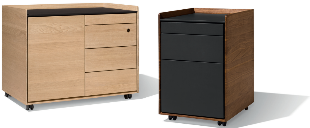
pisa Schreibtisch-Container in zwei Größen