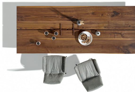
echt.zeit Tisch und lui plus Stühle

Mit der Kontrolle über die gesamte Wertschöpfungskette, der heimischen Produktion und einzigartigen Fertigungstiefe gehört der Ökomöbel-Pionier zu den Weltmarktführern im Bereich der Premium-Massivholzmöbel. Dieser Erfolg ist das Ergebnis von grundlegenden Entscheidungen wie das stringente Festhalten an der Nachhaltigkeit, die Produktion am Standort Österreich und langlebige, individuell gefertigte Qualitätsmöbel.