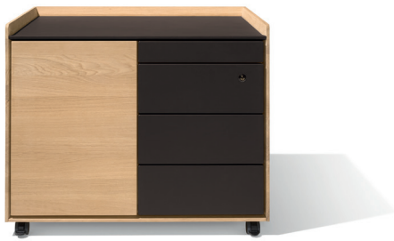
Lederbezug nach Wunsch

„Professioneller Stauraum für Büro oder Home-Office verpackt in einer schlichten und eleganten Hülle aus reinem Naturholz und Leder.“ Designer Kai Stania