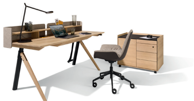
pisa Schreibtisch, pisa Schreibtisch-Container und lui plus Bürodrehstuhl

Es ist diese Kombination aus Handwerk und modernster Technologie, die den Möbeln ihre Seele gibt. Das Zusammenspiel aus sorgsam von Hand gearbeiteten Details und präziser technologischer Fertigung eröffnet neue Dimensionen im Design – und bringt außerdem den betonten Massivholzcharakter mit den hohen Ansprüchen an intelligente Funktionalität in Einklang. Denn um die patentierten Funktionen perfekt in die Gestaltung zu integrieren und dabei dem Material gerecht zu werden, ist eine hohe handwerkliche Expertise gefragt. Von gedämpften Tischauszügen und Schwebetüren bis hin zu höhenverstellbaren Kochinseln, Couch- und Schreibtischen – ein Entwicklungsteam mit außergewöhnlicher Holzkompetenz arbeitet kontinuierlich an Innovationen und deren Umsetzung.