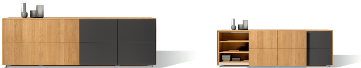
filigno Anrichte 20 mit flächenbündiger Schiebetür

Dank der flächenbündigen Schiebetüren mit Touchbeschlag lässt sich die filigno Anrichte 20 sehr effizient in kleinen Räumen individuell planen. Darüber hinaus setzt das Beimöbel auch optische Statements: Zarte Fugen lösen die großen Flächen der Fronten in filigrane Rechtecke auf und geben dem Möbel seine feine Note. Ganz nach Wunsch pur aus Naturholz oder kombiniert mit einer Farbglas- bzw. Keramikfront. Die Anrichte ist in drei Breiten, zwei Tiefen und allen TEAM 7 Holzarten erhältlich.