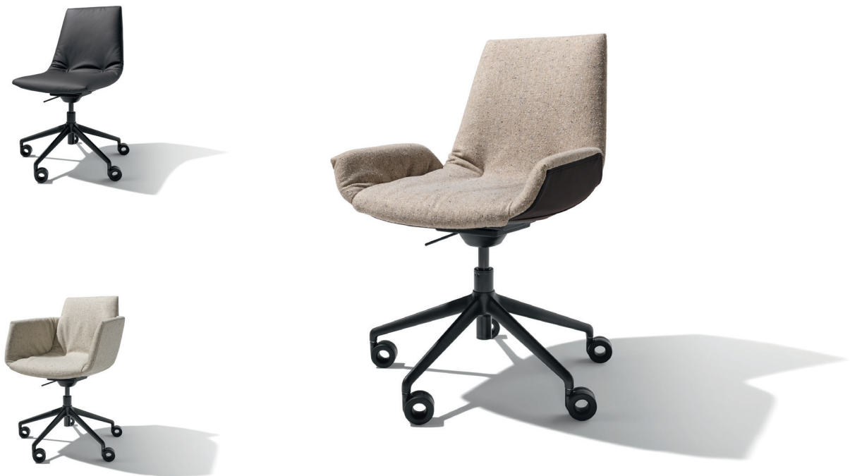
lui, lui plus und grand lui Bürodrehstuhl