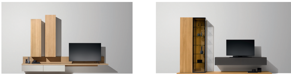
Neue Gestaltungsmöglichkeiten für cubus und cubus pure Wohnwände

Natur pur: Das cubus Wohnprogramm begeistert mit handwerklichen Details und hoher Holzkompetenz, was die 25 mm starke charakteristische Naturholzdeckplatte eindrucksvoll unterstreicht. Für Holzliebhaber, die noch mehr Materialität wünschen, hat TEAM 7 jetzt eine weitere Deckplattenvariante entwickelt. Mit ihrer bemerkenswerten Stärke von 39 mm rückt diese die urwüchsige Kraft und Schönheit von Naturholz haptisch wie optisch noch mehr in den Fokus. Das verleiht den cubus Wohnwänden eine faszinierend neue, geradlinige und moderne Anmutung, bei der die Leidenschaft für Naturholz und seine lebendige Ausstrahlung erlebbar wird. In modernster Dreischicht-technologie gefertigt, überzeugt die innovative Konstruktion zudem mit ausgezeichneter Formstabilität und hoher Belastbarkeit.