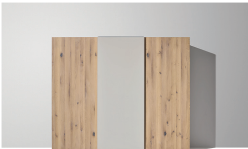
soft Schwebetürenschränk mit neuer Glasfarbe Hellgrau