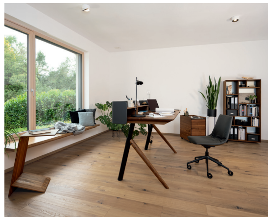
pisa Schreibtisch und lui Bürodrehstuhl

Wenn durchdachtes Design und innovative Technik auf Wohnlichkeit und reines Naturholz treffen, entsteht ein moderner Lebensbereich: das wohnoffice T7 . Damit definiert TEAM 7 die Verbindung von Wohnen, Natur und Arbeiten neu – und geht dabei über die einfache Gestaltung eines Home-Office-Bereiches hinaus. wohnoffice T7 rückt den Menschen und seine Gesundheit in den Mittelpunkt. Dauer und Art der Arbeit bestimmen die technischen und ergonomischen Anforderungen. Die enorme Sortimentsbreite von TEAM 7 bietet hier einzigartige Umsetzungsmöglichkeiten für ganzheitliche Planungen. Denn Home-Working erobert zunehmend private Räume und erfordert intelligente Gestaltungslösungen. Eine Herausforderung, der sich TEAM 7 mit versierten Interieur-Konzepten für professionelles Heimarbeiten stellt. Sie bestechen mit wohnlicher Ausstrahlung, durchdachten Funktionen und hoher Handwerkslichkeit – und stellen sich flexibel auf individuelle Bedürfnisse ein.