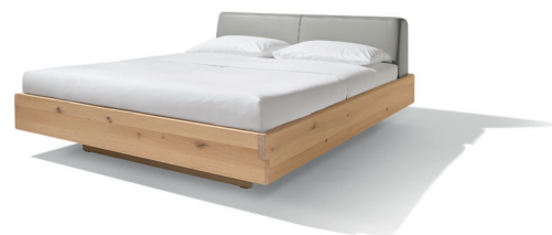
nox* Bett mit neuer Lederfarbe Hellgrau