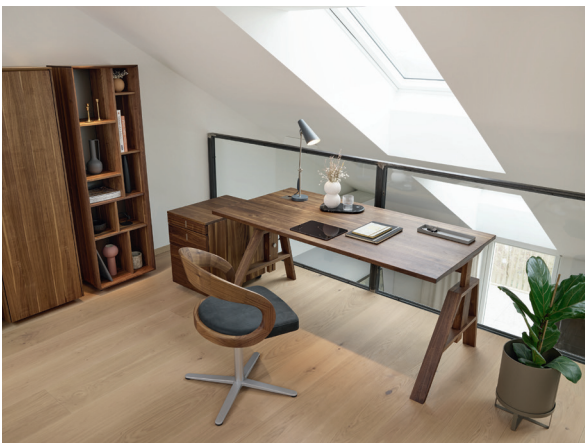
atelier Schreibtisch und girado Drehstuhl